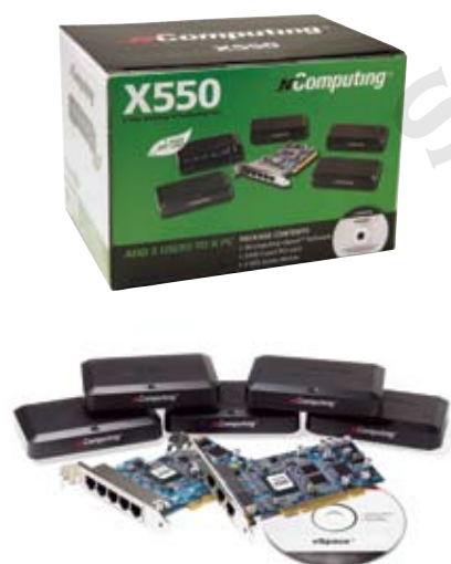
X550 & X350: placas PCI